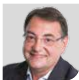
Pr Alain Furber

Nous sommes tous concernés et tout le monde peut agir !