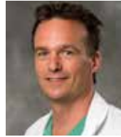
Pr Eloi MARIJON Université de Paris

La majorité des morts subites est inaugurale, c'est-à-dire survient chez des sujets « non-cardiaques » connus.